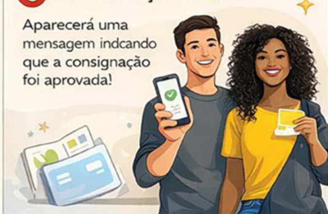
Ilustração representativa do processo no aplicativo do Governo de São Paulo.

Aparecerá uma mensagem indicando que a consignação foi aprovada!